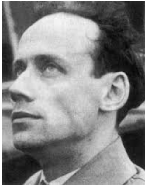
امیل آرتین ۱

در چنین وضعیتی به کار برد. ایدل‌های k زیرگروه‌های جمعی تمام عناصری از \prod k_v هستند که قدرمطلق آن‌ها در همه جز تعدادی متناهی از v ها کمتر یا مساوی ۱ باشد. آن‌ها با ضرب مؤلفه‌وار و یک توپولوژی مناسب، یک حلقه‌ی جا به جایی موضعاً فشرده تشکیل می‌دهند.