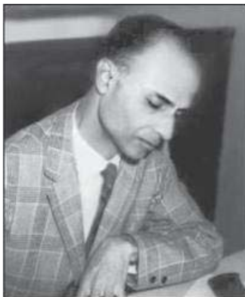
هریش چاندرا ۱

وجود دارد، و فرمول پلانشرال به آنالیز فوریه ی زیرگروه قطری تقلیل می‌یابد. برای SL(n, \mathbb{R}) ، دو زیرگروه کارتان غیرمزدوج (زیرگروه قطری و زیرگروه دوران) وجود دارد. آنالیزی که به فرمول پلانشرال منجر می‌شود دقیق است، اما قلب این آنالیز، آنالیز فوریه روی دو زیرگروه کارتان است. برای SL(n, \mathbb{R}) تعداد 1 + \lfloor \frac{n}{2} \rfloor زیرگروه کارتان غیرمزدوج وجود دارد.