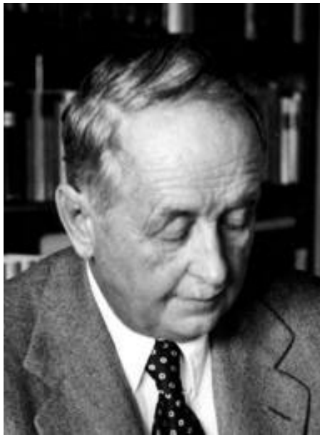
هرمان ویل ۲)

برای آن ماتریس \{f(x_i x_j^{-1})\} همواره هرمیتی نیمه معین مثبت است. قضیه به این صورت است که در بین توابع پیوسته روی \mathbb{R}^n ، توابع معین مثبت دقیقاً آن توابعی هستند که تبدیل فوریه‌ی اندازه‌های متناهی هستند. گاردینگ در سال ۱۹۵۳ تبدیل فوریه روی \mathbb{R}^n را با چیزی که قبلاً ابداع شده بود یعنی یک «اصل انجماد ۱) » ترکیب کرد تا توانایی تبدیل فوریه را به قلمروهایی گسترش دهد که در آن‌ها هیچ‌گونه تقارنی تحت یک گروه به چشم نمی‌خورد. «نامساوی گاردنیک» کران پایینی برای ضرب داخلی \langle Lu, u \rangle به دست می‌دهد که در آن L یک عملگر دیفرانسیل حقیقی بیضوی از مرتبه‌ی m بوده و u دارای محمل فشرده می‌باشد. استفاده از فرمول پلانشرال حالتی را فراهم می‌کند که در آن تمامی جملات از مرتبه‌ی m بوده و دارای ضرایب ثابت هستند.