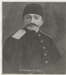
عکس روی جلد:

تصویری از علیخان ناظم‌العلوم رک. مقاله «مرگ تاریخی علیخان ناظم‌العلوم و ریاضیات او»